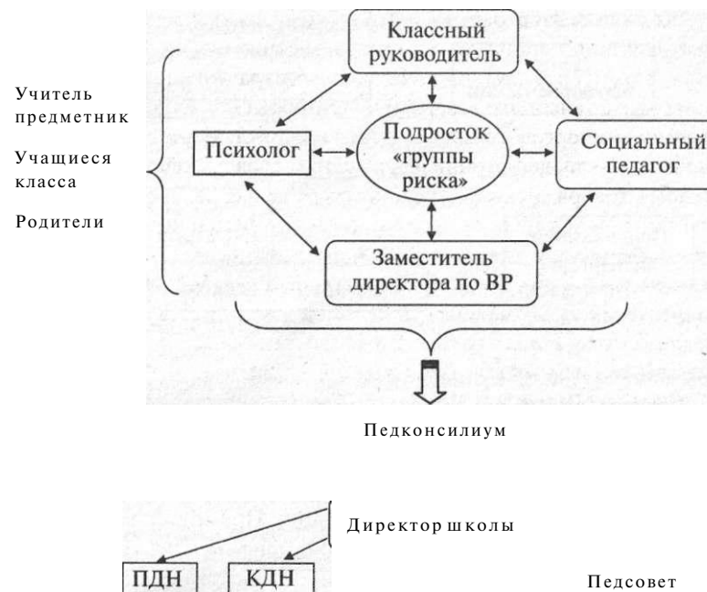
Рис. 4. Взаимодействие специалистов в образовательном учреждении

Эколог контролирует выполнение законов, инструкций, правил и норм по охране окружающей среды. Проводит исследова-