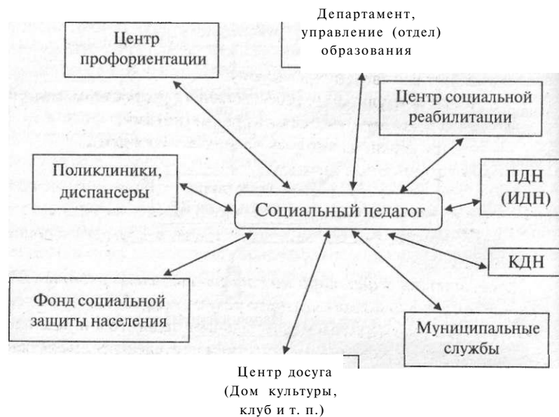
Рис. 5. Взаимодействие социального педагога с учреждениями и организациями